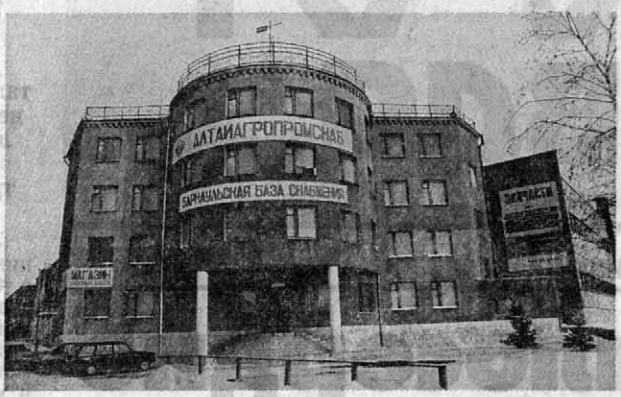
Как работали в прошлом году? Объем товарооборота по АО «Алтайагропромснаб» составил 127,8 млн. руб. - увеличился почти в 2 раза.