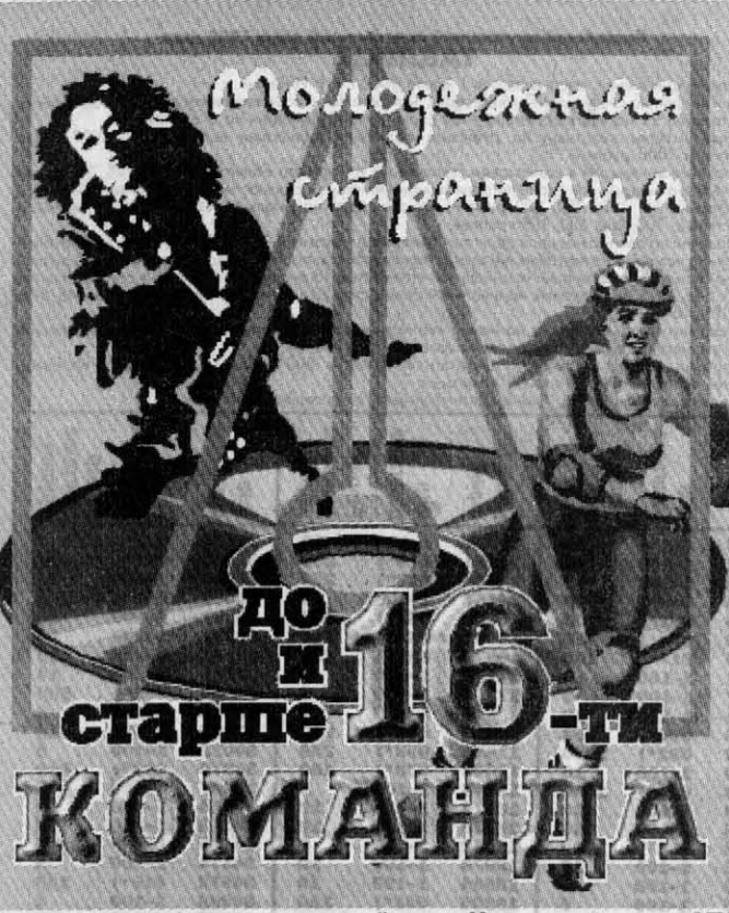
Выпуск подготовлен при содействии Интернет-центра АГУ