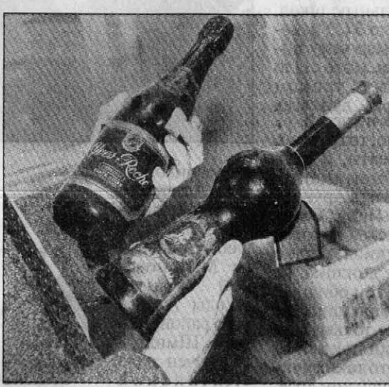
(Начало на 1 стр.)

Тут невозможно оправдаться. Если за ночь продалась, как говорится, две-три, зачем тогда 85 держишь? Если не твое, то чье? Ах, экспедитор! Не знаю, мне или на БЛВЗ подслушай, или по дороге заменили. Смешно и наивно. А где же ты был, экспедитор? Словом, изобретаются как могут.