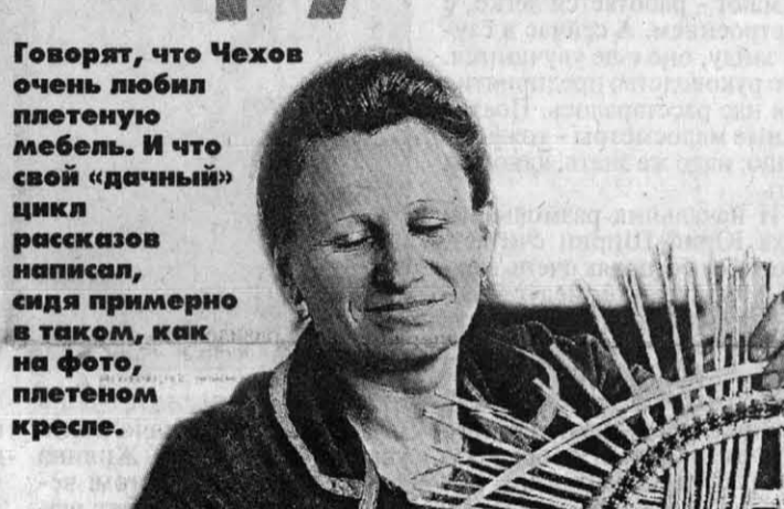
Говорят, что Чехов очень любил плетеную мебель. И что своей «дачный» цикл рассказов написал, сидя примерно в таком, как на фото, плетеном кресле.