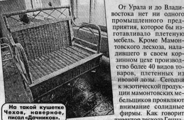
На такой кушетке Чехов, наверное, писал «Дачников».