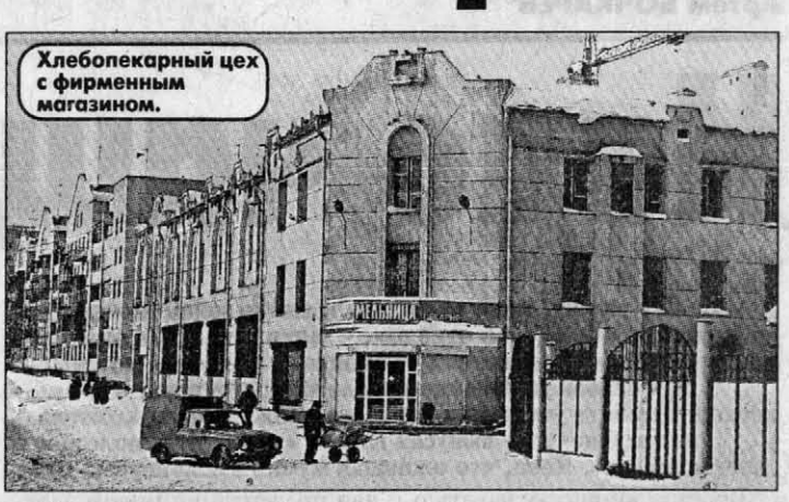
Хлебопекарный цех с фирменным магазином.