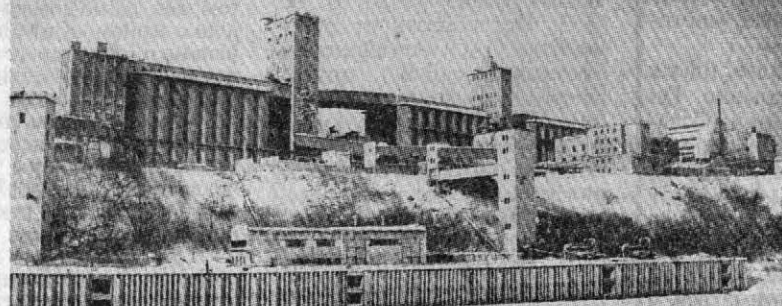
«Мельница». Вид с Оби.

- Задачу такую нам поставил рынок. Мы могли бы уже и на 60 процентов выйти. Но надо было удержать и высокое качество, нужное рынку. Удержали. Вот так познанию и продвигается.