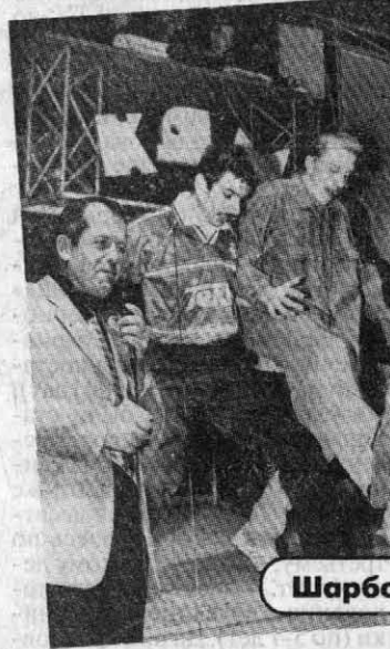
Шарбол на сцене

Информационно поддержали праздник тележурнал «Вечерний экспресс» (ГТРК «Алтай») и радио «Пилигрим».