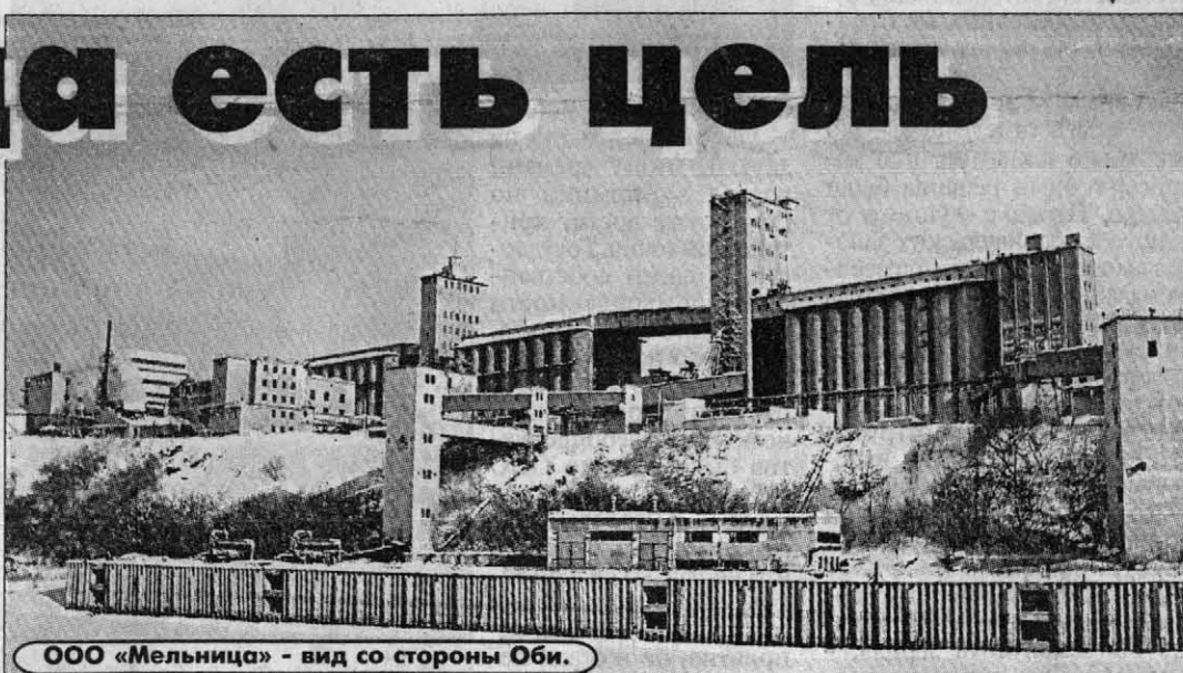
ООО «Мельница» - вид со стороны Оби.

В суматошной тогдашней жизни, в сумасбродстве тогдашних экономических правил - а было это около пяти лет назад - собеседники мои, возможно, были и правы. Но и сегодня они без энтузиазма встретили мой звонок. А слышали только потому, что напираю на юбилейную дату. Пора открыться. Речь о