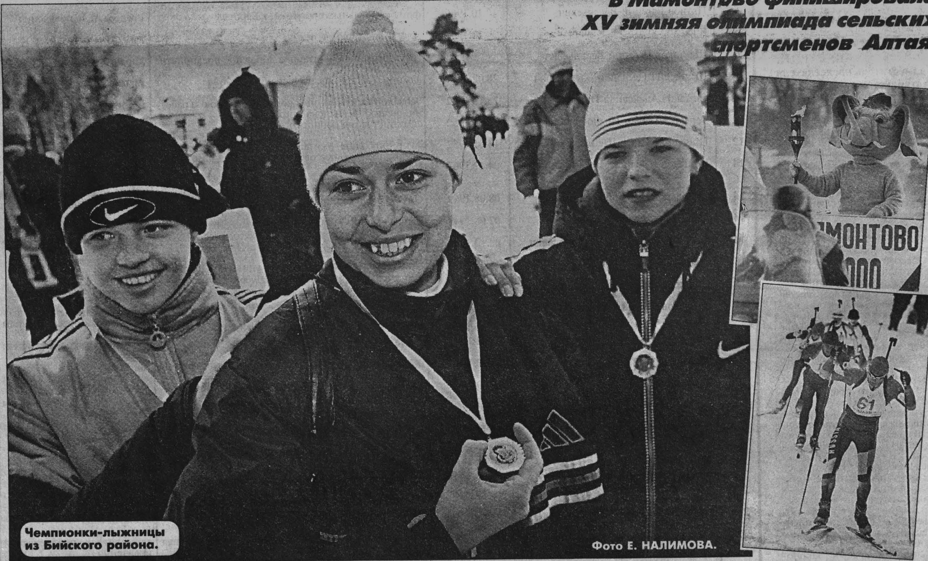
Чемпионки-лыжницы из Бийского района.

В Мамонтово финишировала XV зимняя олимпиада сельских спортсменов Алтая.