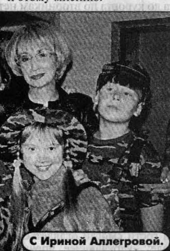
С Ириной Аллегровой.

«Спасибо Барнаулу за «Каприз!» - написала Лариса Рубальская на праздничном буклете, переданном администратору города. Что ж, мы можем только присоединиться к этому мнению.