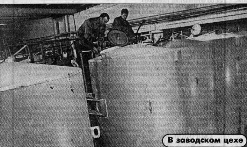
В заводском цехе