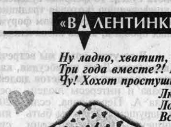
Вариант подарка любимому.

Приучен комсомолом и судьбой застывает бюстгальтер за собой! И женщина, как буря, улетелась... Слава Богу, я пока запуталась в бабах, а не в чем-нибудь другом... Так изменила, но в мыслях - никогда! Я даже к мужу своему привык!