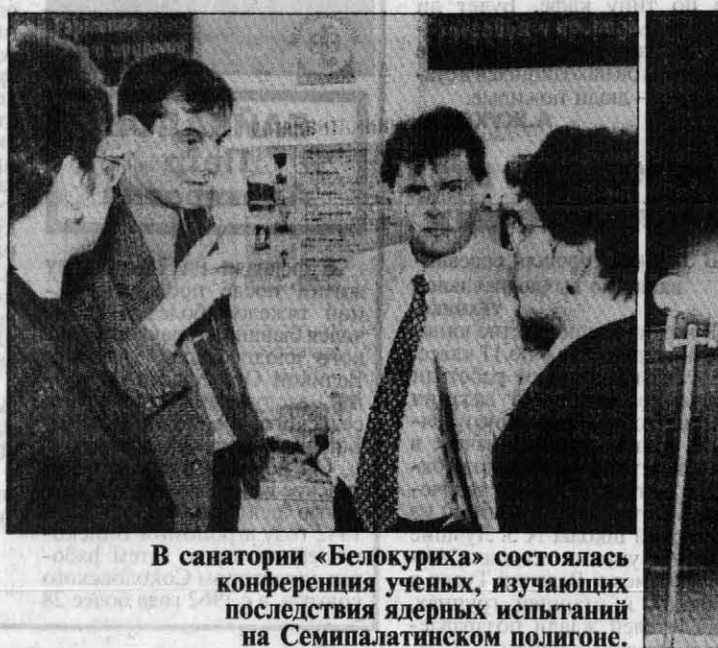
В санатории «Белокуриха» состоялась конференция ученых, изучающих последствия ядерных испытаний на Семипалатинском полигоне.