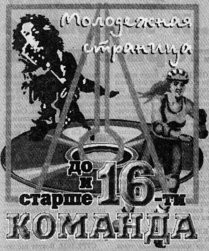
Ведущий выпуска - Артем БОЧКАРЕВ.