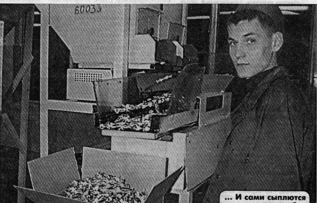
... И сами сыплются в коробку

Они-де стали добавлять в сырье ненатуральные добавки, поэтому шоколад уже не тот. К тому же новые хозяева никаких инвестиций не вкладывают, а прежних