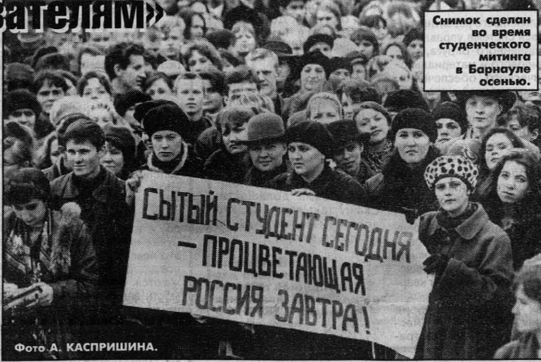
Снимок сделан во время студенческого митинга в Барнауле осенью.