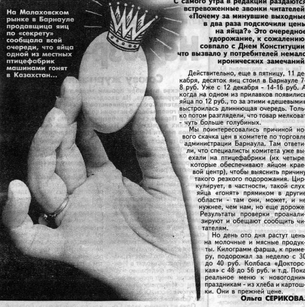
На Малаховском рынке в Барнауле продававшая яйца по «секрету» сообщила всей очереди, что яйца одной из местных птицефабрик машинально гонят в Казахстан...

С самого утра в редакции раздаются встревоженные звонки читателей: «Почему за минувшие выходные в два раза подскочили цены на яйца?» Это очередное удорожание, к сожалению, совпало с Днем Конституции, что вызвало у потребителей немало иронических замечаний. Действительно, еще в пятницу, 11 декабря, десяток яиц стоил в Барнауле 7-8 руб. Уже с 12 декабря - 14-16 руб. А когда на одном из прилавков появились яйца по 12 руб., то за этими «дешевыми» выстроилась длинная очередь. Только потом разглядели, что товар мелковат - чуть больше голубиных. Мы заинтересовались причиной нового скачка цен в комитете по торговле администрации Барнаула. Там ответили, что специалисты комитета уже выехали на птицефабрики (их четыре, которые обеспечивают яйцом краевой центр), чтобы выяснить причину такого резкого подорожания. Циркулирует, в частности, такой слух: яйца «гонят» прямоком в другие области - там они, может, и не нужнее, чем нам, но еще дороже. Результаты проверки проанализируют и обещают сообщить читателям. Но день ото дня растут цены на молочные и мясные продукты. Килограмм фарша, к примеру, подорожал за неделю с 30 до 40 руб. Колбаса «Докторская» с 48 до 56 руб. и т.д. Пока реальное меню к новогодним праздникам - из хлеба и картошки. Они в прежней цене. Ольга СЕРИКОВА.