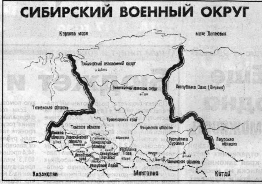
СИБИРСКИЙ ВОЕННЫЙ ОКРУГ

Товарищ генерал-полковник, новый военный округ - свершившийся факт. Но, как известно, были и другие мнения, сомнения в целесообразности принятого решения?