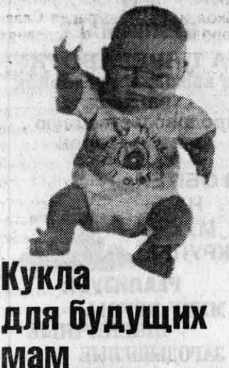
Кукла для будущих мам

Проявления хламидиоза столь разнообразны, что ими занимается врачи различных специальностей. Сергей ПУТИНЦЕВ, уролог: У больных урологического профиля хламидиоз обнаруживают вместе с ка-