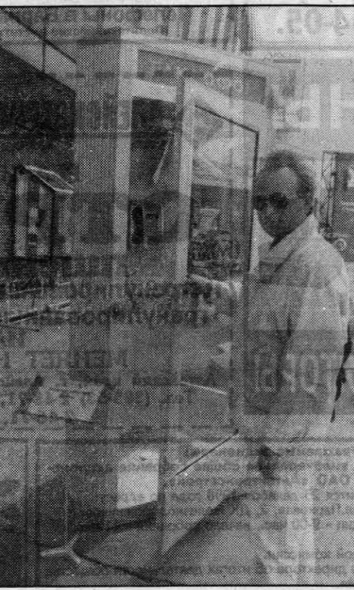
Московская фирма «Россы-А» предлагает радиотаксофон, который может работать вдали от населенных пунктов. На буровых, на полевых станках. Правда, пока его можно увидеть только на выставках...