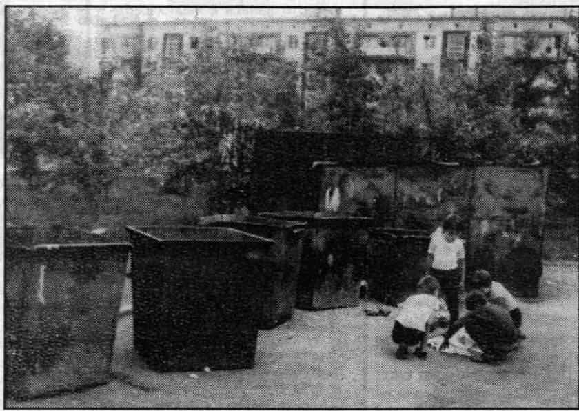
В алтайских лесах наркомания получила прописку с прилегающими из мест лишения свободы...