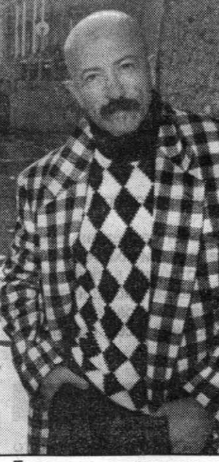
Теперь все это смогут вновь оценить по достоинству и барнаульские поклонники артиста.

Иронический характер заслуженного артиста России Александра Розенбаума его поклонникам хорошо известен. Ну, кто еще из отечественных исполнителей может позволить себе посвятить очередную концертную программу юбилею... песни? А Розенбаум - может!