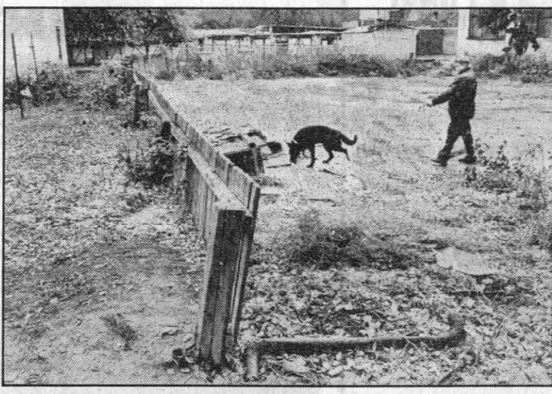
постановлению, к осени должна была появиться хоккейная коробка на улице Балтийской. Но Индустриальный район так и не начал ее строить.

Но была, была еще надежда, что не все так плохо. Ведь нам предстояло окинуть взглядом места ледовых сражений в Ленинском районе. Для непосвященных - здесь базируется специализированная детско-юношеская школа «Хоккей», объединившая несколько ребячьих клубов и хоккейных коробок. В 1995-м одна из здешних команд «Факел» по-