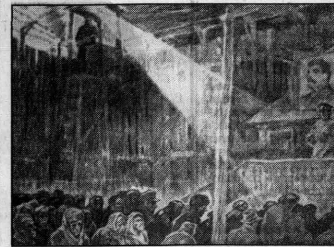
Работа художника-графика Михаила Дистергефта впечатлительно иллюстрирует трагедию депортации и трудармии.

И после войны сталинские обвинения продолжали тяготеть над российскими немцами. Их не пускали в вузы, специалисты не могли занимать соответствующие должности, запрещалось выезжать из мест поселения далее