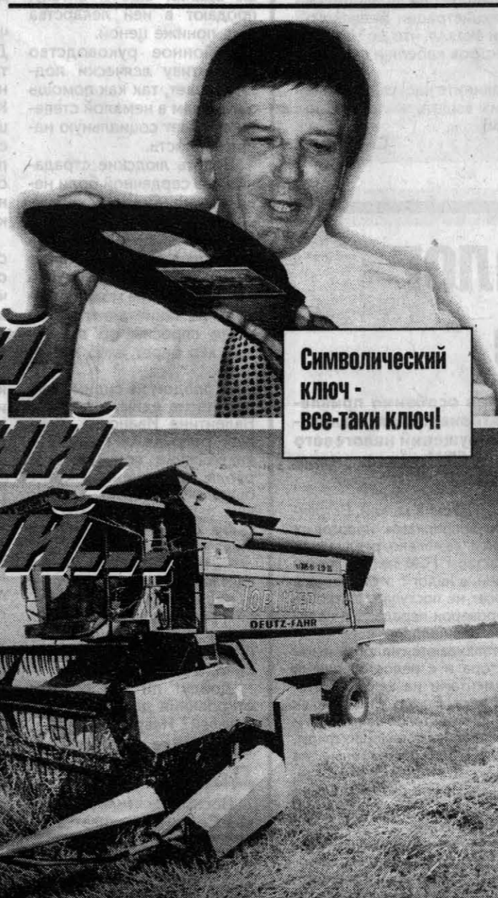
Символический ключ - все-таки ключ!