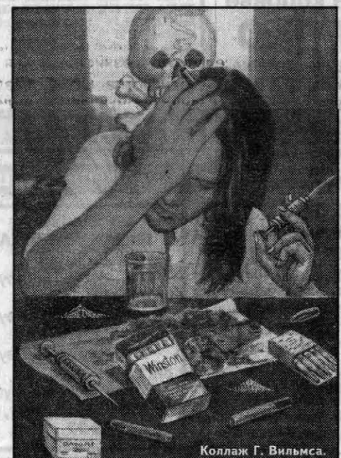
Коллаж Г. Вильяма.

За спиной на двери лязнул замок. Я оказался в зарешеченном «чулке», в четвертой палате, на территории «острого» отделения краевой наркологической больницы. С десятком вновь прибывших наркоманов. Моя официально огороженная легенда: алкоголик Алексеев, сотрудник престижной фирмы, в страхе увольнения тайком приехавший в «Хвойный» отлежаться. Лечение в «Хвойном» добровольное, но везде - на дверях и окнах - прочные решетки.