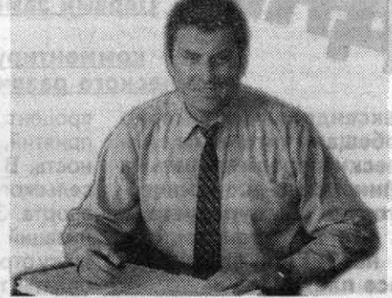
Мне представляется, что проблема обеспечения населения края работой, проблема эффективной занятости займут в ближайшие годы одно из центральных мест в работе краевой и муниципальной администраций.

Практику поддержки села, в том числе через обеспечение устойчивого рынка сбыта производимой сельхозпродукции, мы будем продолжать и впредь. Важно всем нам понять, что это интересы не только сельских (они в лихую годину прокормятся на своей земле), но и всех жителей края. Далее, подготовка к зиме. Уже сейчас в администрации края развернута соответствующая работа, и по мере приближения холодов мы ее будем усиливать. Наконец, рабочие места и своевременная выплата зарплаты. Здесь от администрации зависит меньше всего, ведь 85 процентов общей задолженности приходится на предприятия и организации негосударственного сектора экономики. Тем не менее ситуация с выплатами из бюджета непростая. Она заметно обострилась в июле месяце. Сумма бюджетной задолженности по оплате труда по сравнению с июнем возросла на четверть; просроченная задолженность из-за отсутствия бюджетного финансирования составила 25,1 процента общего объема задолженности предприятий государственной и 20 процентов - предприятий негосударственной формы собственности.