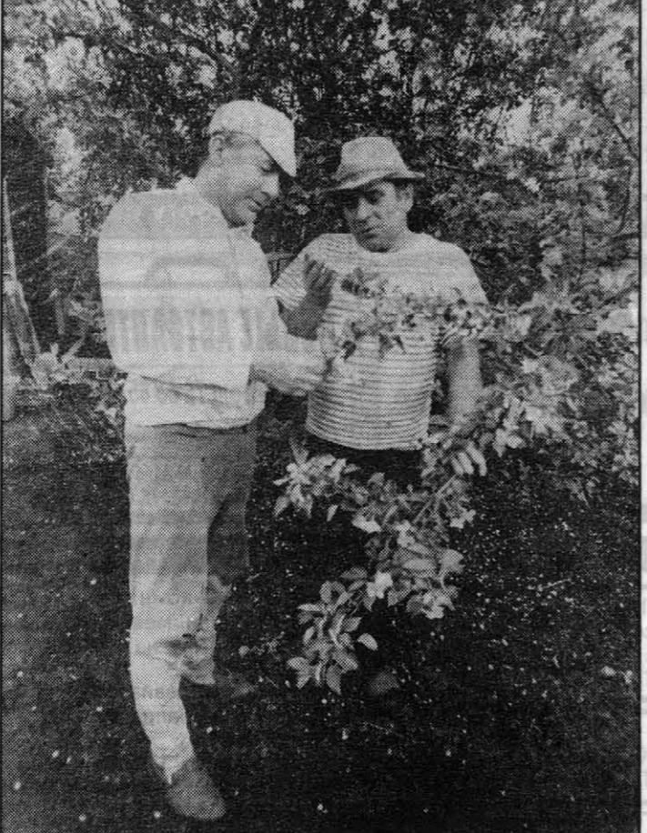
Ну и чем же ты хочешь меня удивить?

Не страшны комары и мошки Работать в саду нам зачастую мешают комары и надоедливая мошка, которая лезет в глаза, рот, уши. Есть такой совет, как избавиться от атак кровопийцев. Возьмите сало и отрежьте корочку. Слегка посолите ее мелкой солью и потрите те места, которые вы хотите защитить. Но только обязательно посолите. Для чего? Когда закончите работу и начнете умываться, места, потертые соленым салом, легко будет смыть.