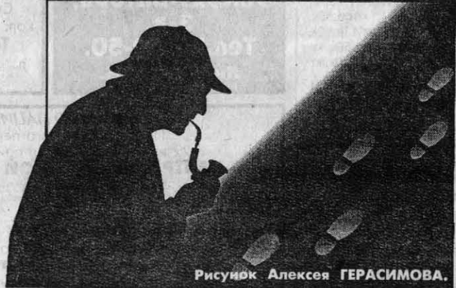
Рисунок Алексея ГЕРАСИМОВА.

вершины. Холмс, конечно, тут же припал к этим следам с увеличительным стеклом. И так, шаг за шагом, добрался