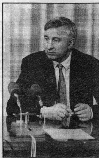
рования экономики края.

В прошедшее воскресенье в Алтайском крае побывал министр путей сообщения России Николай Аксененко. В ходе визита было подписано соглашение о взаимодействии между Министерством путей сообщения, Западно-Сибирской железной дорогой и администрацией края.