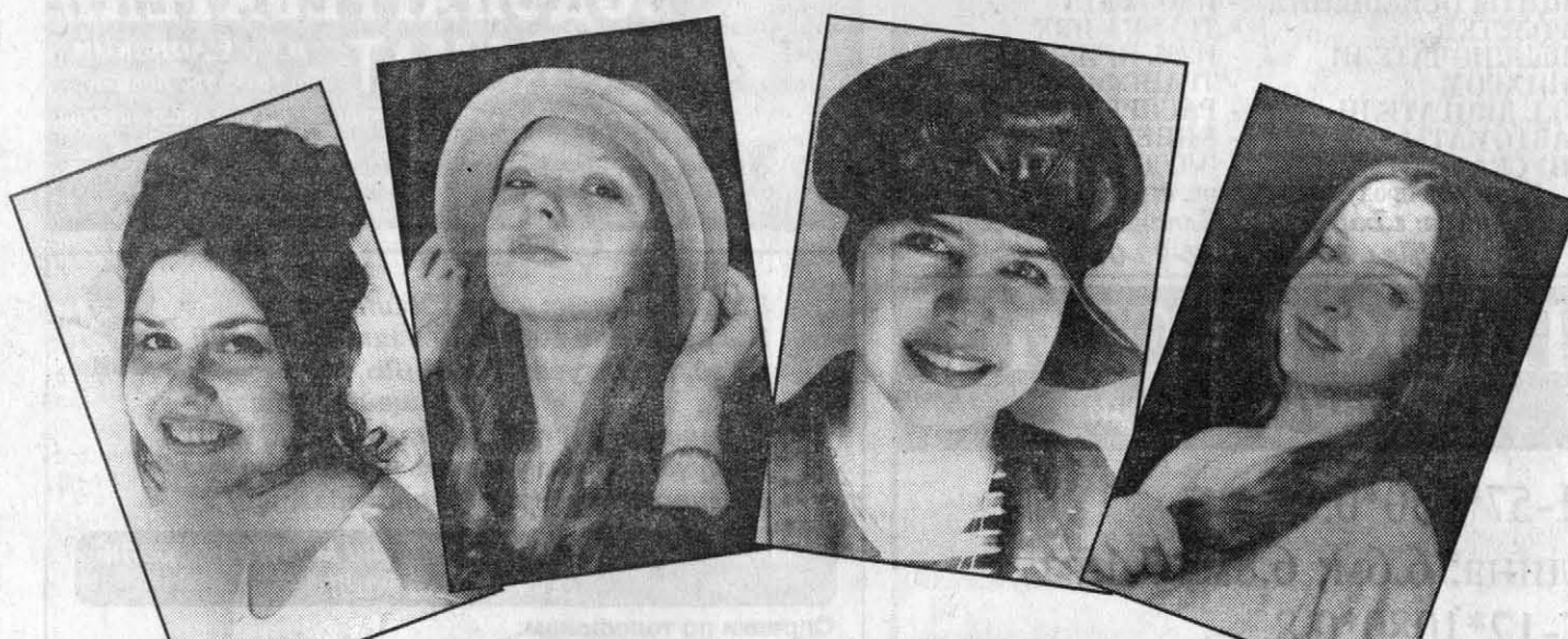
Событием в жизни Рубцовска стало создание театра моды, который подарил горожанам праздник красоты с созвучным названием «Шоу моды».

Хотя на рубцовском подиуме не блистали дефиле от Диора, Сандерли и Лагерфельда, коллекция получилась внушительная. В лице кутюрье выступили рубцовские модницы, а на суд зрителей они представили строгий деловой стиль костюмов и шик вечерних туалетов в номинации «плате для принцессы», обширную коллекцию верхней одежды - от привычных дубленок до ультрамодных коротких кашемировых пальто. Но при чем здесь создание театра? Модели демонстрировали выпускницы школы имиджа, о которой «АП» уже рассказывала. «Шоу моды» стал для них своеобразным экзаменом, причем перед незнакомой публикой.