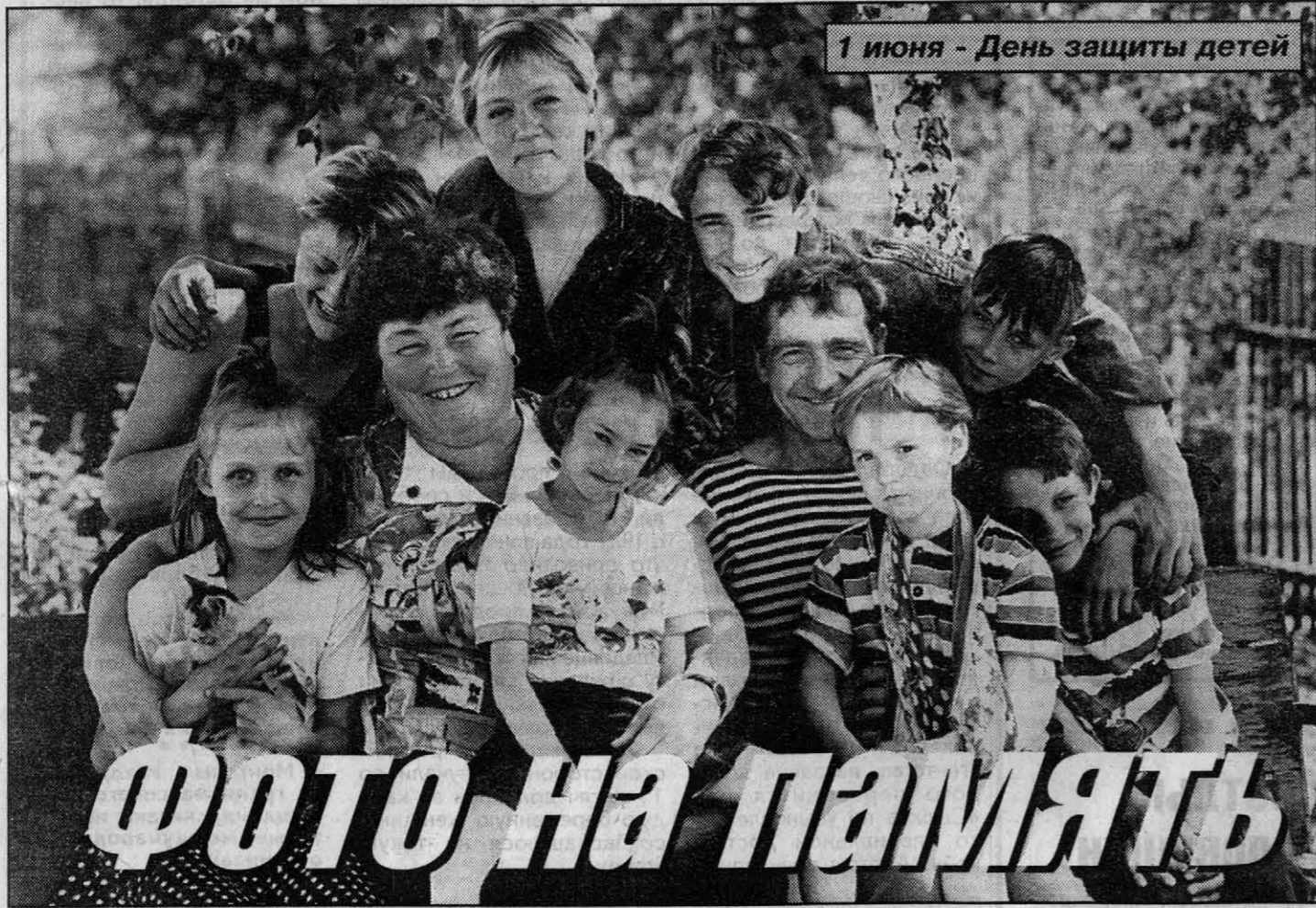
1 июня - День защиты детей