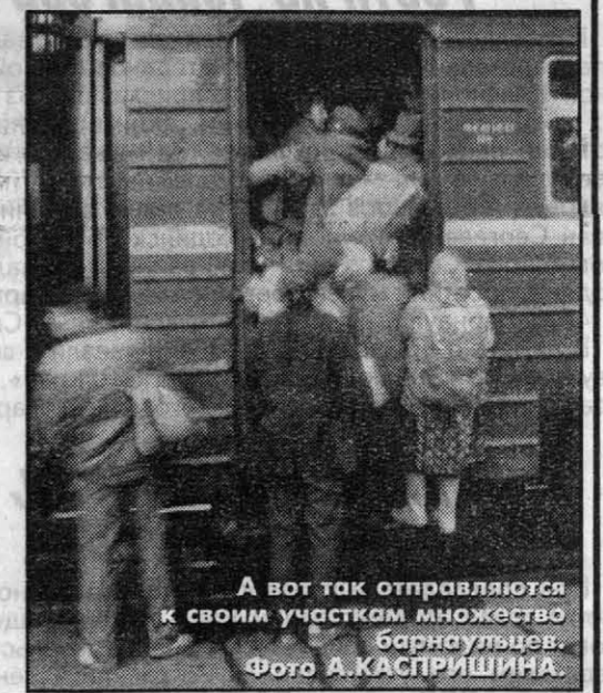
А вот так отправляются к своим участкам множество барнаульцев.