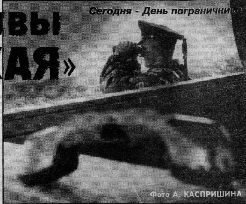
Сегодня - День пограничника

По решению совета МАСС в ближайшее время на этом участке планируется строительство новых погранзастав. Например, «Барнаулскую», которая протянулась более чем на 100 км на участке, который зафиксировано 90% всех нарушений границы, надо бы разбить на несколько. В этом же, но по дру-