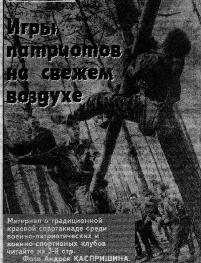
Игры патриотов на свежем воздухе Материал о традиционной краевой спартакиаде среди военно-патриотических и военно-спортивных клубов читайте на 3-й стр.