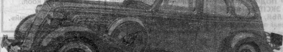
ЗИС-101 с кузовом лимузин. 1936 г.