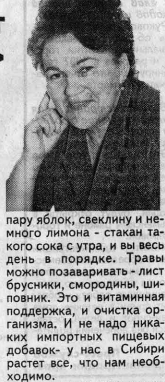
пару яблок, свеклину и немного лимона - стакан такого сока с утра, и вы весь день в порядке. Травы можно позаваривать - лист брусники, смородины, шиповника. Это и витаминная поддержка, и очистка организма. И не надо никаких импортных пищевых добавок - у нас в Сибири растет все, что нам необходимо.

Я одно могу сказать твердо: доброта может растопить любой лед. У меня сын очень рано женился, и мы с отцом, конечно, переживали сначала, что вот, мол, им еще учиться надо, совсем дети, какая женьтиба!