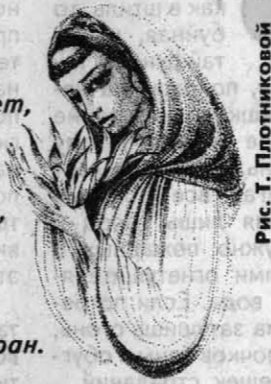
Рис. Т. Плотниковой

Я тебе - от всяких бед, От летящих в пропасть лет, От болезней, от напастей, От утраты, от несчастий, От обиды, от разлуки, От сердечной тайной муки, Одиночества ночного И от спутника пустого, От худого слова, сглаза И от всех печалей сразу. Я - от пуль, смертельных ран. Просто я - твой талисман.