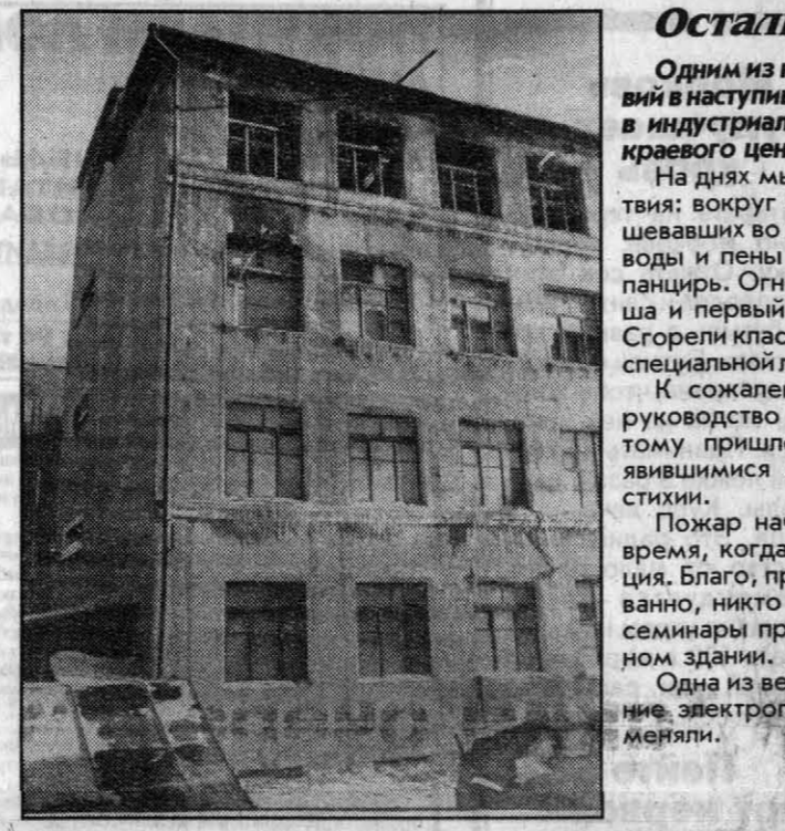
Остались без крыши...

Одним из наиболее серьезных происшествий в наступившем году можно считать пожар в индустриально-педагогическом техникуме краевого центра. На днях мы побывали на месте происшествия: вокруг четырехэтажного здания от бешеных потоков воды и пены образовался мощный ледовый панцирь. Огнем полностью уничтожены крыша и первый этаж. Ущерб подсчитывается. Сгорели классные комнаты с телевизорами и специальной литературой. К сожалению, во время нашего визита руководство техникума отсутствовало. Поэтому пришлось поговорить с учащимися, являющимися свидетелями разгрома огненной стихии. Пожар начался в 16 часов, как раз в то время, когда шли занятия. Началась эвакуация. Благо, прошло все достаточно организованно, никто не пострадал. Сейчас лекции и семинары проходят в маленьком двухэтажном здании. А в нем, конечно же, тесно. Одна из версий причины пожара - замыкание электропроводки, которую перед этим меняли.