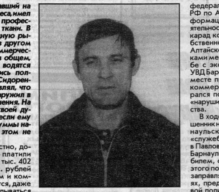
уже никому не товарищ, а гражданин под следствием, и полковником никогда в своей жизни не был.

Из прожитых 51 года 20 лет он провел в местах лишения свободы. Совершенные им преступления - кражи, хищения, грабеж и изнасилование привели к тому, что народный суд признал его особо опасным рецидивистом. В последний раз «полковник» был осужден на 11 лет за изнасилование несовершеннолетней, самозвольное присвоение звания и власти должностного лица. 31 марта 1997 года он досрочно освобожден из мест лишения свободы, за 2 года 24 дня до окончания определенного судом срока. При освобождении назвал будущее место своего жительства, однако туда не прибыл, на учет в РОВД, как положено, не встал. В декабре прошлого года в отдел собственной безопасности управления