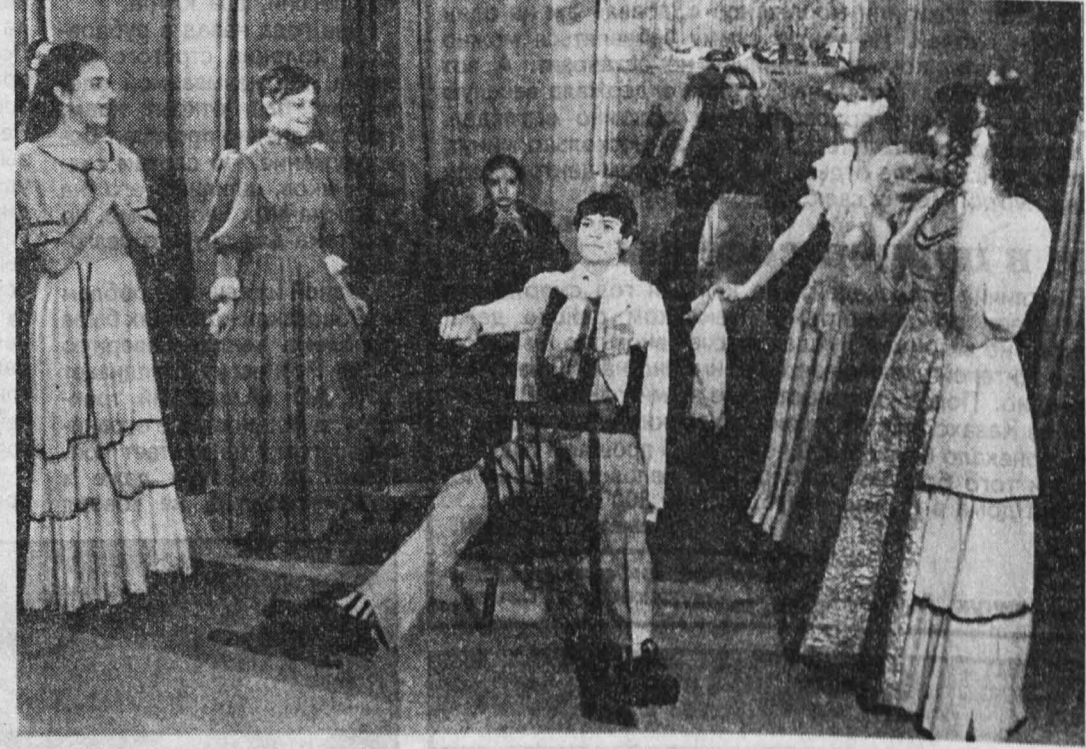
НА СНИМКЕ: сцена из спектакля «Замоскворецкий мечтатель».

В Локтевском районе возник большой конфликт из-за постройки одного - единственного частного дома. Взбунтовалась добрая четверть жителей села Успенки. Дело в том, что новая усадьба перекрыла самый короткий и едва ли не единственный путь из Заречья в центр села. А в центре - все: школа, больница, магазины. Кто же додумался так обидеть зареченцев? Виноватых много. Прежний глава села, давший добро на строительство. Прежний хозяин усадьбы, начавший стройку без разрешения архитектора. Новый хозяин, «дивнувший» забор так, что наглухо перекрыл проулок. В конфликте были вовлечены большие силы: депутаты, пресса, совет ветеранов, архитектура. И... собака, которую хозяин дома грозит привязать к забору, чтобы отпугивать настырных зареченцев. Л. СТРИЖКИН, Локтевский район.