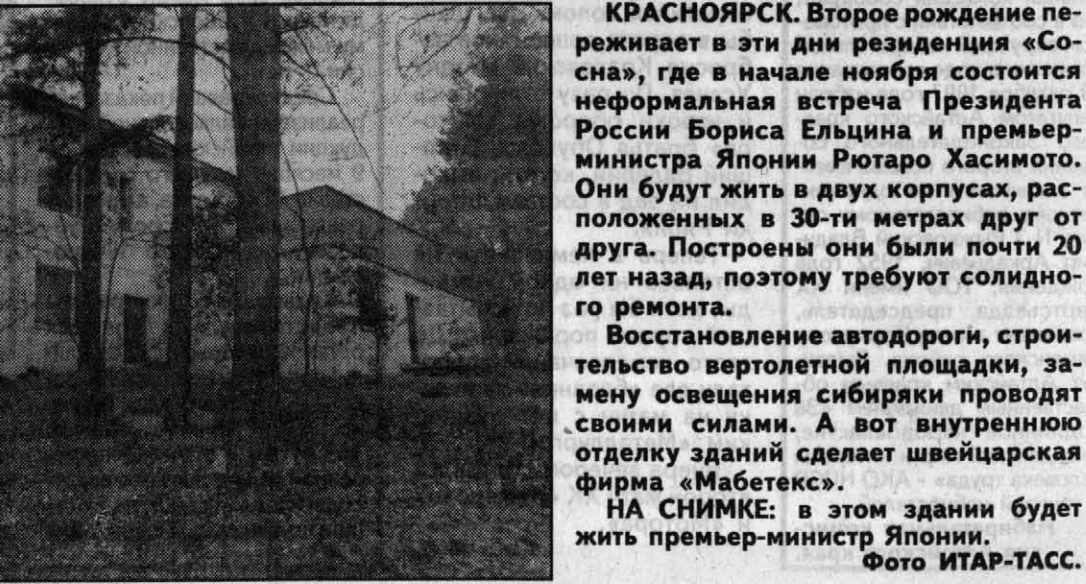
КРАСНОЯРСК. Второе рождение переживает в эти дни резиденция «Союза», где в начале ноября состоится неформальная встреча Президента России Бориса Ельцина и премьер-министра Японии Рютаро Хасимото. Они будут жить в двух корпусах, расположенных в 30-ти метрах друг от друга. Построены они были почти 20 лет назад, поэтому требуют солидного ремонта.

Восстановление автодороги, строительство вертолетной площадки, замену освещения сибиряки проводят своими силами. А вот внутреннюю отделку здания сделает швейцарская фирма «Мабетекс».