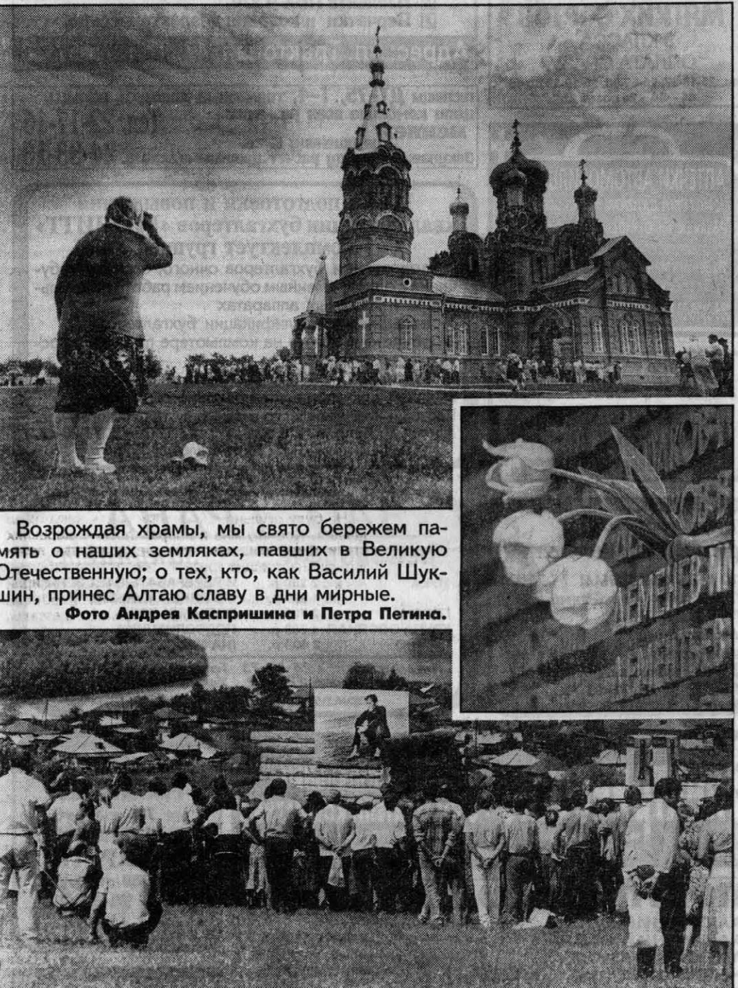
Возрождая храмы, мы свято бережем память о наших земляках, павших в Великую Отечественную; о тех, кто, как Василий Шукшин, принес Алтаю славу в дни мирные.