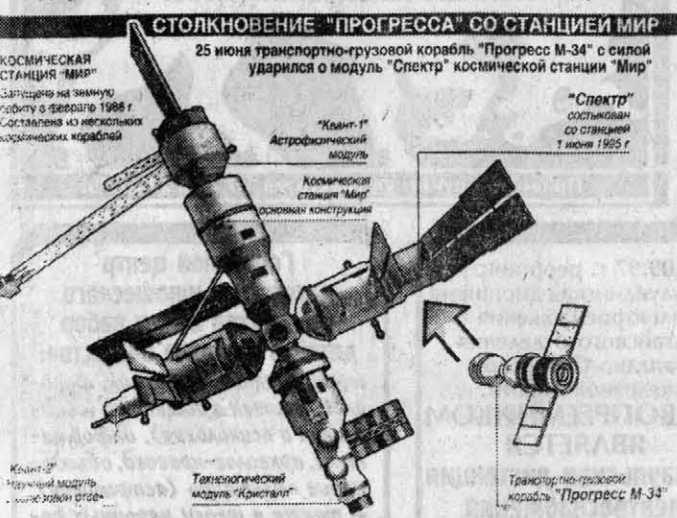
Столкновение «ПРОГРЕССА» со СТАЦИЕЙ МИР. 25 июня транспортно-грузовой корабль «Прогресс М-34» с целью уборки в модуль «Спектр» космической станции «Мир» уварился о модуль «Спектр» космической станции «Мир».

А вы думаете, на новой станции «Альфа» действительно будут стоять космандиры? Без опыта дли-