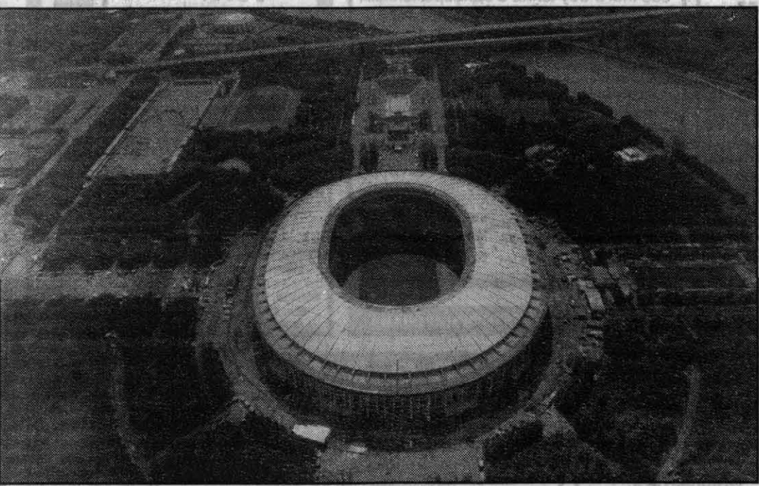
МОСКВА. На большой спортивной арене в Лужниках закончился монтаж гигантского козырька (на снимке) по периметру всего сооружения. Строители планируют завершить основные работы к 850-летию столицы.