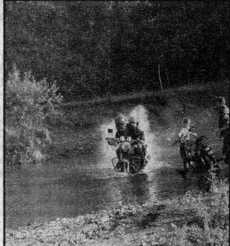
Ход спортивной борьбы был очень напряженным. Сама природа создала всевозможные препятствия для спортсменов.