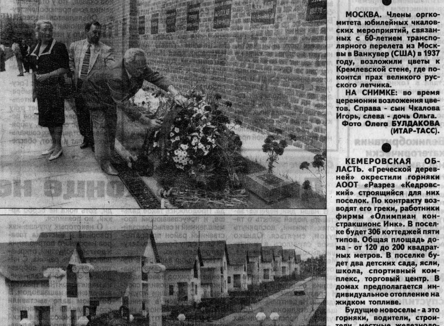
МОСКВА. Члены оргкомитета юбилейных чкаловских мероприятий, связанных с 60-летием транслярного перелета из Москвы в Ванкувер (США) в 1937 году, возложили цветы к Кремлевской стене, где поконится прах великого русского летчика.