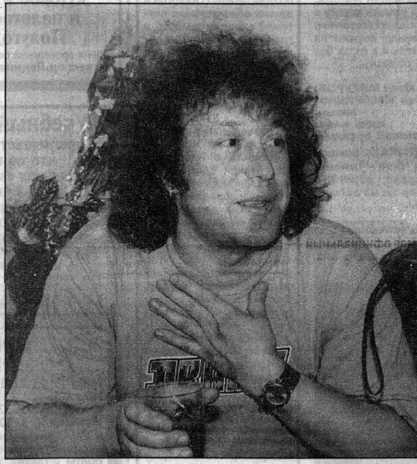
Когда ему нужно избавиться от мрачных мыслей и расслабиться, он садится на мотоцикл и гонит своего металлического коня по шоссе. В памяти его компьютера хранятся его сочиненные стихи и поэмы.

ми любимые шлягеры, а взволнованные поклонники буквально завалили своего кумира цветами.