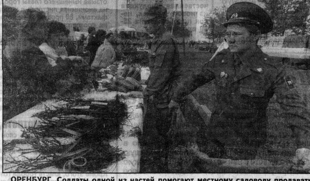
ОРЕНБУРГ. Солдаты одной из частей помогают местному садоводу продавать черенки и саженцы (на снимке). А садовод, в свою очередь, поставяет в часть выращенные им фрукты.