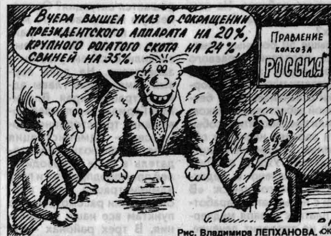
Вчера вышла УКАЗ О СОКРАЩЕНИИ ПРЕЗИДЕНТСКОГО АППАРАТА на 20%, КРУПНОГО РОЯТОГО СКОТА на 24%, СОВНЕЙ на 35%.

С нынешнего мая правительство Москвы сняло все ограничения на поставку в столицу отечественного продовольствия.