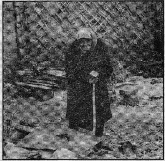
но войти дважды. Хочется думать, что новое поколение (не из тех нуворишей, которые шикуют сегодня) распрямит свои плечи и не позволит с рабской покорностью обирать себя и страну...

Этот снимок сделан корреспондентом каменской газеты незадолго до... Нет теперь на земле этой старушки, немало потрудившейся на веку.