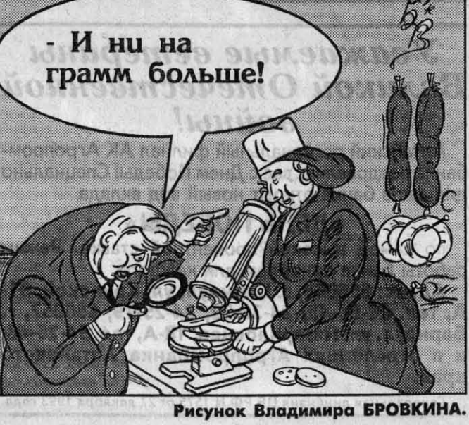
Рисунок Владимира БРОВКИНА.

если есть минимум, будет и максимум. Если не у тебя, так у кого-то... Помни: человек - существо общественное. Мало раз в месяц посещать баню с дешевым мылом или отдавать свой голос, выбирая меньшее... Надо лично общаться с себе подобными. Почему бы не пригласить соседя, отдавая предпочтение тому, кто не курит, не пьет и принципиально не ходит в гости? Счастлив тот, кто доволен собой, женой и прожиточным минимумом. Кто не облизывается на прошлое, как на сметану. Ну, что там интересного? Приди-ка в ту пору в магазин, попроси колбасы на тысячу? Моментально из толпы нарисуются два мужика стертой наружности и спросят: - Откуда такие деньги? - И молчок. А скажут, так не со зла: - Господи, и откуда такой идиот взялся? Как говорится в одном рекламном ролике, сравните - и вы почувствуете разницу. Виктор ТИТОВ.