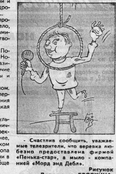
Рисунок Владимира БРОВКИНА.

чило, как всегда. Иностранец долго сердился, отказывался от интервью. Но когда его отловили у трапа самолета, заявил: - Сюда, господи, а больше не ездки. Лучше буду спать дома с женой, чем в гостинице с клопом. С тем и убыл. А вы говорите: реклама! Виктор ТИТОВ.