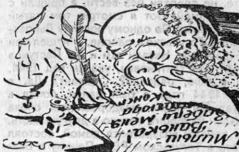
Крестьянские заботы собрали А. АСТАПОВ, А. ГОМЗЯКОВ, И. МИКУРОВ. Рис. А. Храпенко.