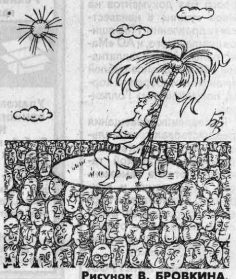
Рисунок В. БРОВКИНА.