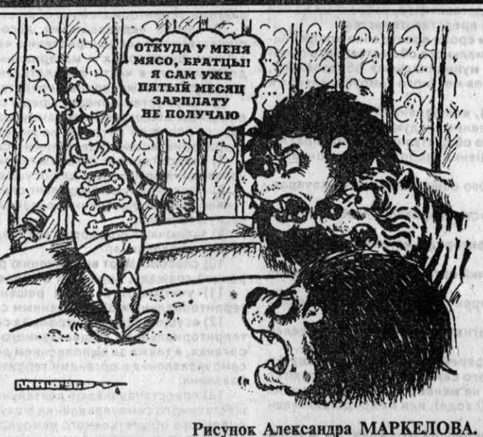
Рисунок Александра МАРКЕЛОВА.