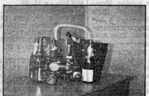
Знающие люди объясняют, отчего сегодняшние трудности со сдачей бутылки в нашем крае.

Можно ли в Барнауле сдать бутылку? Можно, если есть время и не жалко ног, потому что зачастую приходится походить по городу с тяжелой сумкой.