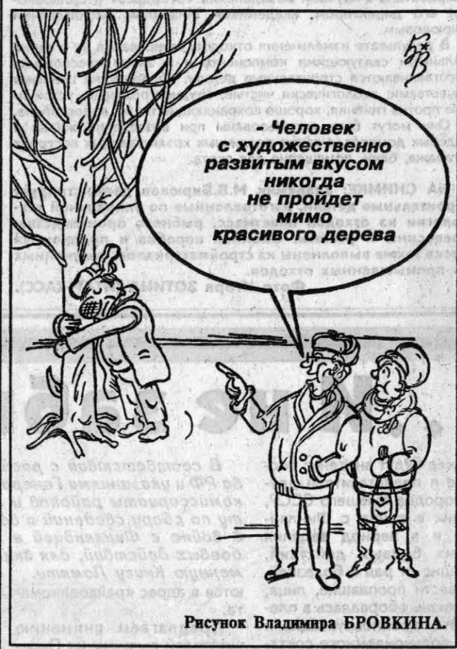
Рисунок Владимира БРОВКИНА.

Выпуск подготовили Тамара МИХАЙЛЕНКО, Константин ЕРМОЛИН.