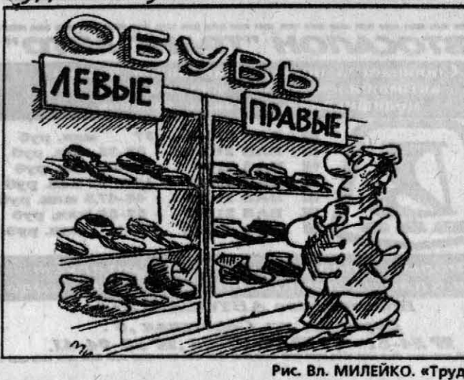
Рис. Вл. МИЛЕЙКО. «Труд»