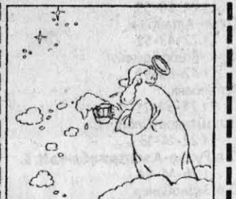
Рис. В. Александрова P.S. В общественном эле виноваты все. Один действует, другие позволяют. Ю. Арачев

На юго-западе Малой Азии (на территории современной Турции) с конца 2-го тысячелетия до нашей эры жили карийцы. Там в городе Галикарнасе скульпторы Пифей и Сатир в 353 году до н.э. начали строить гробницу для карийского царя Мавсола. Событие, даже не гробницу, а целый погребальный ансамбль, ставший позже одним из «семи чудес света». От имени Мавсола и пошло название «мавзолей». Ансамбль строился очень долго: был закончен уже в середине IV века, после смерти царя. Но до наших дней это «чудо света» не дошло. В XV веке мавзолей был безжалостно разрушен мусульманскими фанатиками во время одного из сражений.