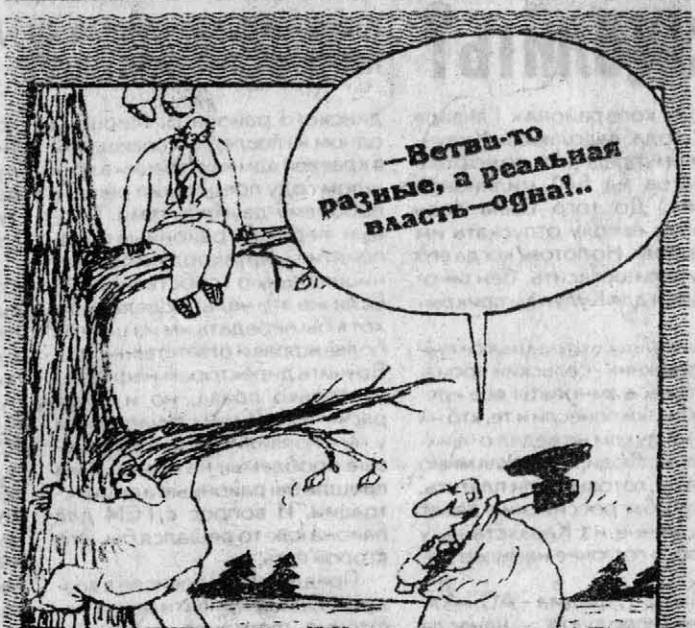
Рис. Вячеслава Шилова.