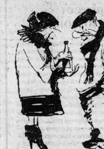
- Сидоров, купи у меня бутылочку, а то до зарплаты не дотянуть...