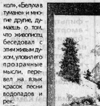
Г. Гуркина. «Белува в тумане»

И глядя на гуркинские полотна - эпическую поэму в красках «Хан - Алтай», «Корона Катунь», «Кедра», «Могила шамана», «Озеро Катунь», «Белува в тумане» и многие другие, думаешь о том, что живописец беседовал с этим живым духом, уповил его прозрачные мысли, перевел на язык красок песни водопадов и рек.