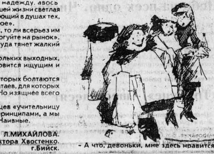
- А что, девоньки, мне здесь нравится!