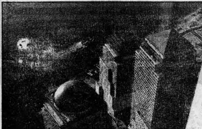
В объективе - Нью-Йорк

Содрогнитесь, беззаботные! Древние легенды приписывают царю Соломону необыкновенную мудрость. Совсем другого мнения о нем современные экологи, изучившие последствия его деяний. Когда-то библейский герой приказал вырубить кедровые стволы в горах Ливана для сооружения большого храмового комплекса. Тысячи лесорубов были посланы на хребты, где росли еще дубы, сосны, густые можжевеловые заросли. Лесоповал опустошил обширную зону. Уже следующее поколение местных жителей стало испытывать недостаток воды, ибо пересохли ручьи, началась эрозия склонов, пустыня стала надвигаться на поля и виноградники. Это произошло пять тысяч лет назад, а страны Леванта до сегодняшнего дня испытывают на себе последствия царского тщеславия. Не случайно в Библии содержится предупреждение о неразумности разрушения природы, которое приведет к осуждению земли и потере последнего листика. «Содрогнитесь, беззаботные, ужаснитесь, беспечные!»