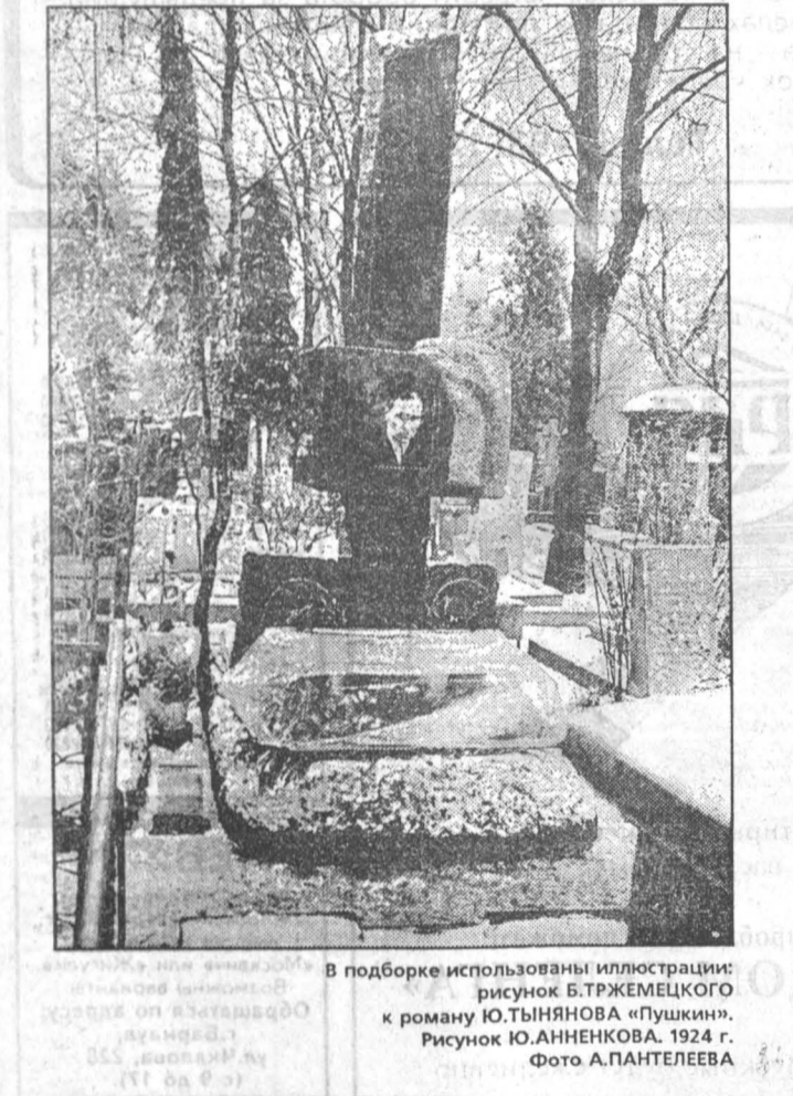
В подборке использованы иллюстрации: рисунок Б.ТРЕЖЕМЕЦКОГО к роману Ю.ТЫНЯНОВА «Пушкин». Рисунок Ю.АННЕНКОВА. 1924 г.